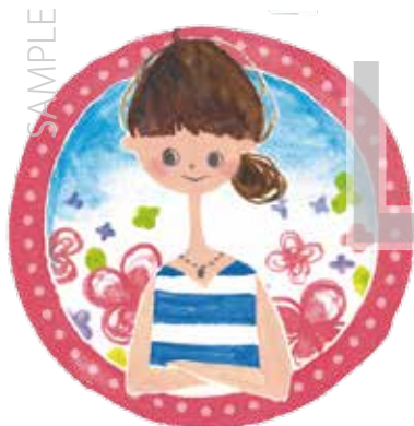
〇〇市 福祉保健部 健康推進課