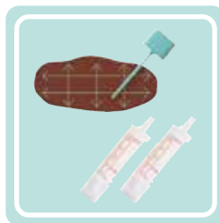
容器のフタについた棒で便の表面を採取